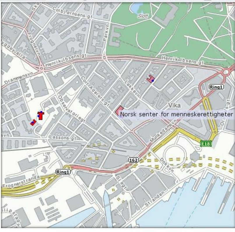
Norsk senter for menneskerettigheter, Cort Adlers gata 30 (ved siden av Vika trikkeplass)